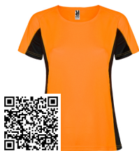
SHANGHAI WOMAN CA6648