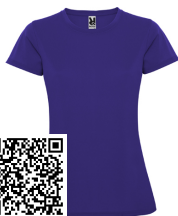
MONTECARLO WOMAN CA0423