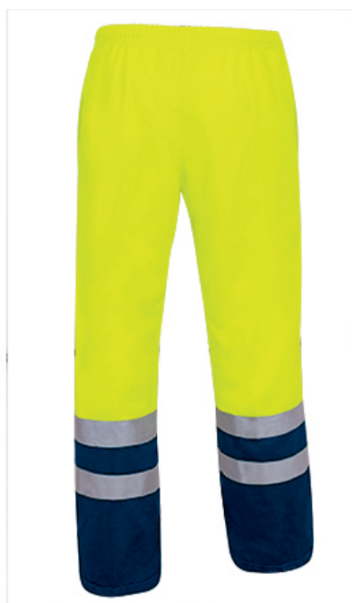
Vista parte trasera de la prenda