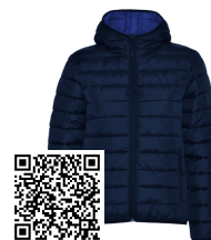
NORWAY WOMAN RA5091