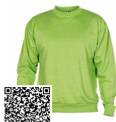
CLASICA 50/50 TUBULAR SU1070A50