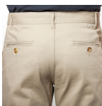
Duo Concept PA9107