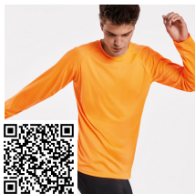
MONTECARLO L/S CA0415