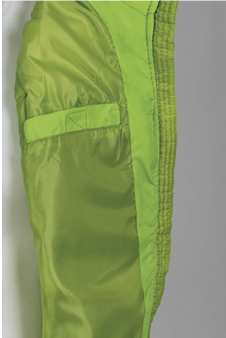
Vista parte trasera de la prenda (espalda)