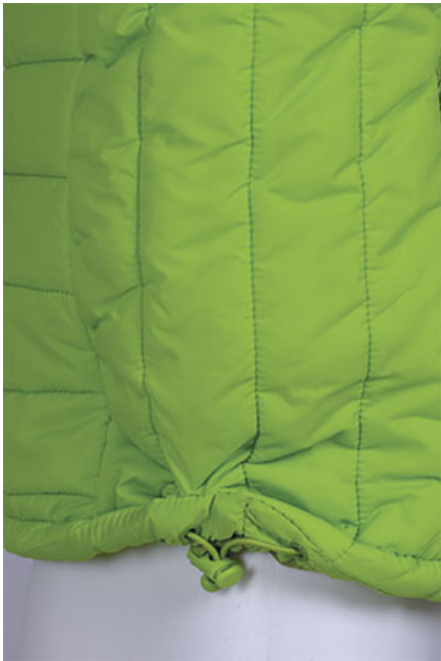
Detalle cordón regulador y freno de ajuste en cintura