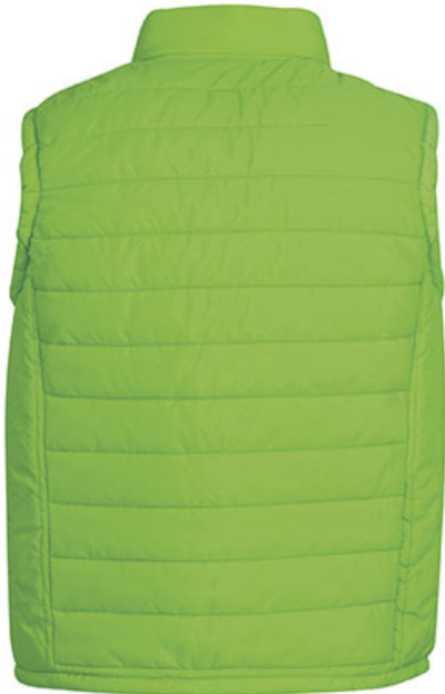
Vista parte trasera de la prenda (espalda)