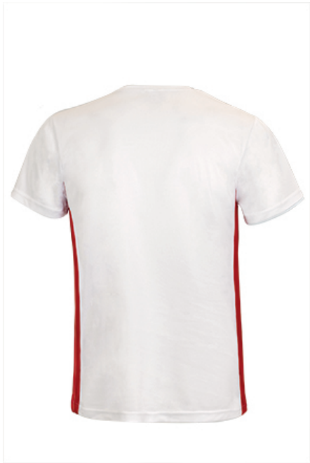
Vista parte trasera de la prenda (espalda)