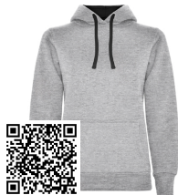
URBAN WOMAN SU1068