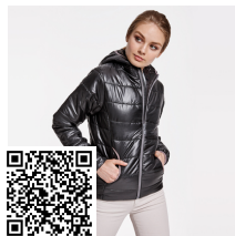
GROENLANDIA WOMAN RA5082