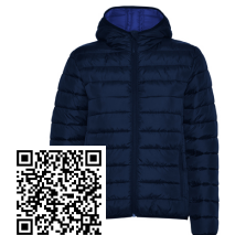
NORWAY WOMAN RA5091