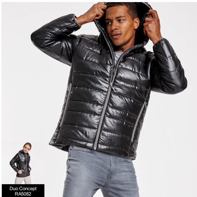
Duo Concept RA5082