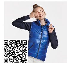
MONTANA WOMAN RA5084